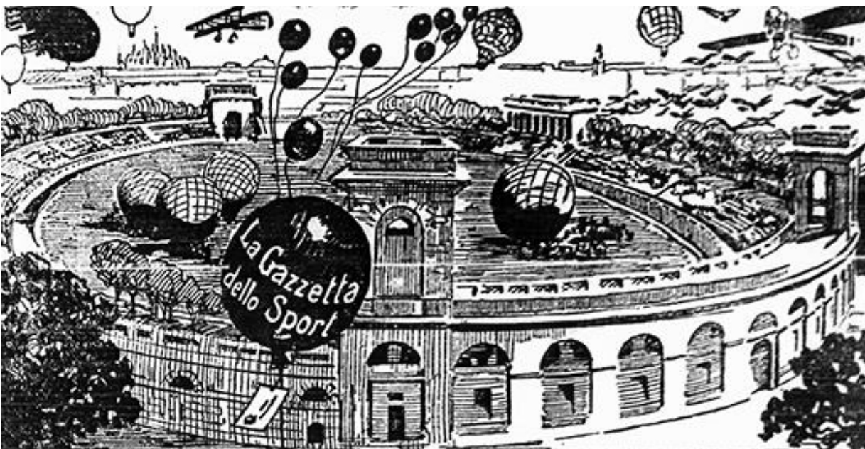
2. La festa dell'aeronautica, Gazzetta dello Sport, 2 maggio 1913. A illustrazione del programma dei festeggiamenti che si sarebbero svolti due giorni dopo all'Arena di Milano il disegno raffigura in primo piano il lancio di palloncini-pilota per lo studio delle correnti aeree, sulla destra il rilascio di migliaia di colombe messaggeri e sul prato dell'Arena gli "sferici" pronti alla partenza. Sullo sfondo un dirigibile, aeroplani e aerostati in volo su Milano.