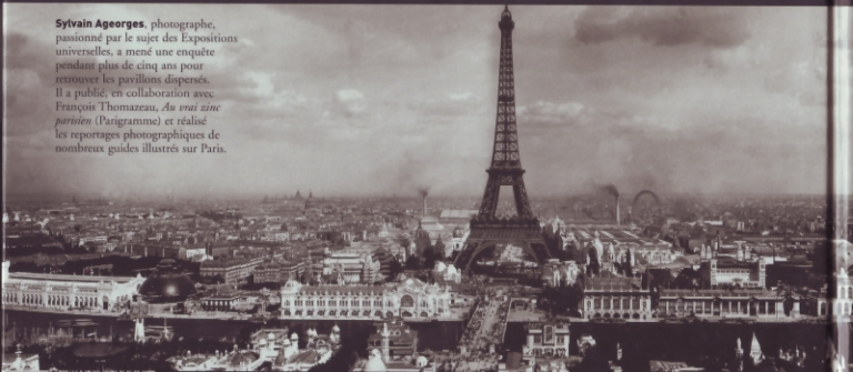
Couverture : Exposition universelle de 1900, panorama vu du pont Alexandre-III. ci-dessus : Exposition universelle de 1900, parc du Champ-de-Mars et.